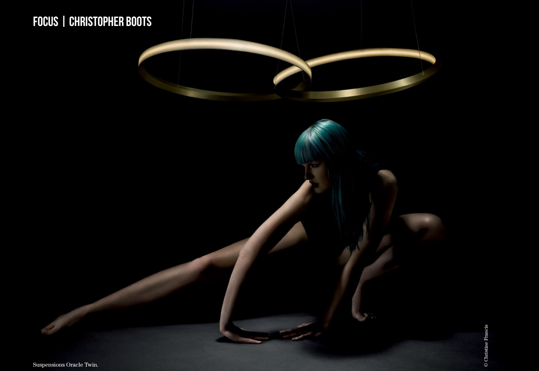
Suspensions Oracle Twin.