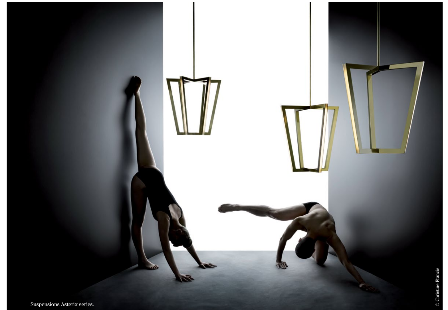
Suspensions Asterix series.