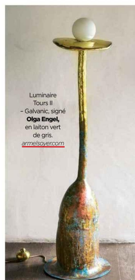
Luminaire Tours II - Galvanic, signé Olga Engel , en laiton vert de gris. armelsoyer.com