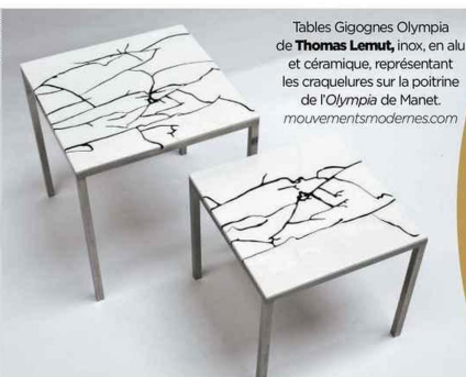
Tables Gigognes Olympia de Thomas Lemut , inox, en alu et céramique, représentant les craquelures sur la poitrine de l'Olympia de Manet. mouvementsmodernes.com