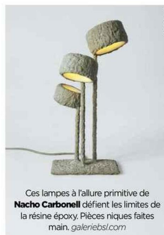
Ces lampes à l'allure primitive de Nacho Carbonell défient les limites de la résine époxy. Pièces niques faites main. galeriesbl.com