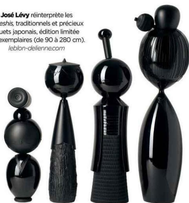
José Lévy réinterprète les kokeshis, traditionnels et précieux jouets japonais, édition limitée à 8 exemplaires (de 90 à 280 cm). leblon-dellenne.com