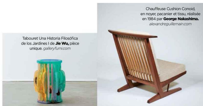
Tabouret Una Historia Filosófica de los Jardines I de Jie Wu , pièce unique. galleryfumi.com