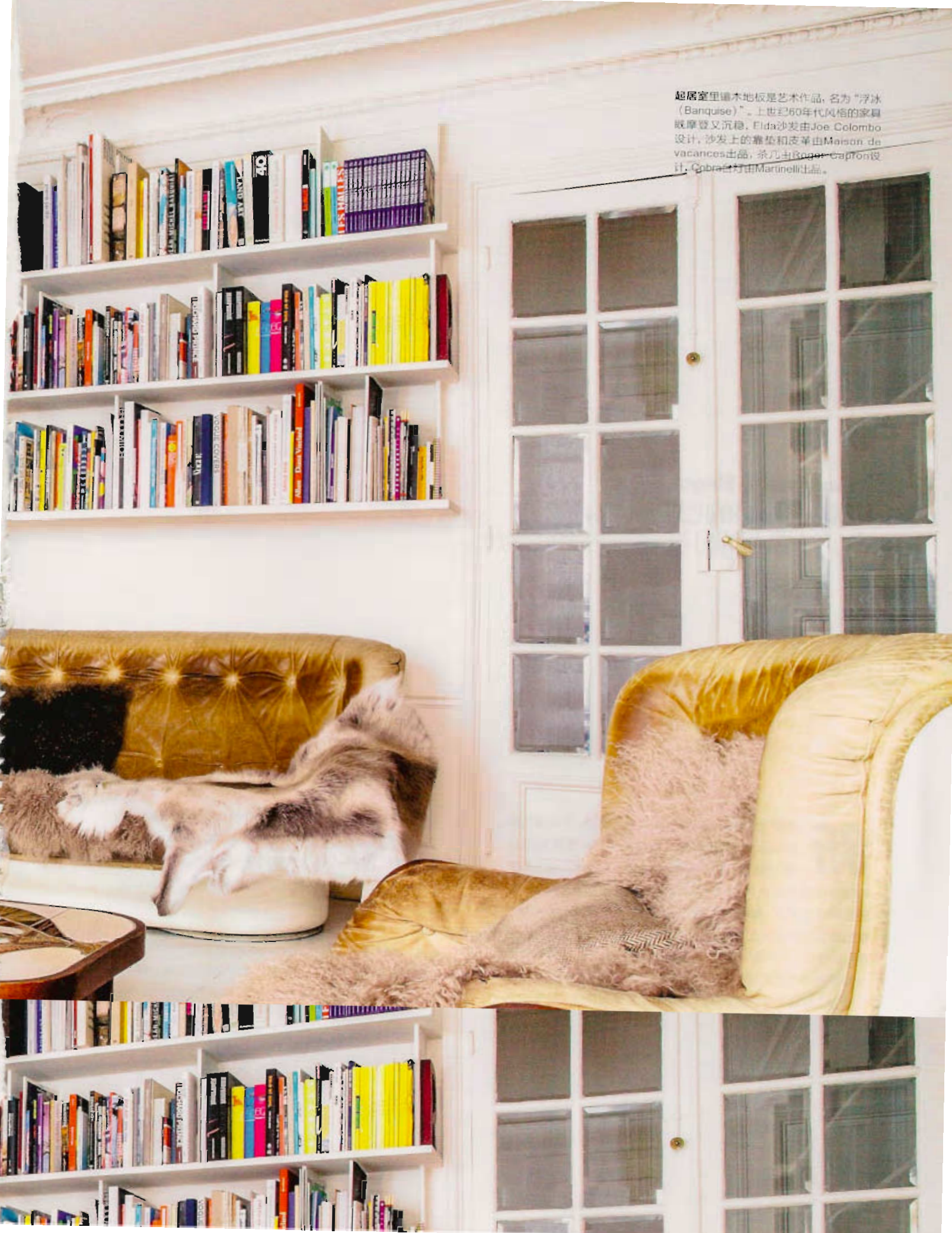
起居室里铺木地板是艺术作品，名为“浮冰（Banquise）”。上世纪60年代风格的家具既摩登又沉稳，Eida沙发由Joe Colombo设计，沙发上的靠垫和皮革由Maison de vacances出品，茶几由Roger Capton设计，Cobra台灯由Martinelli出品。