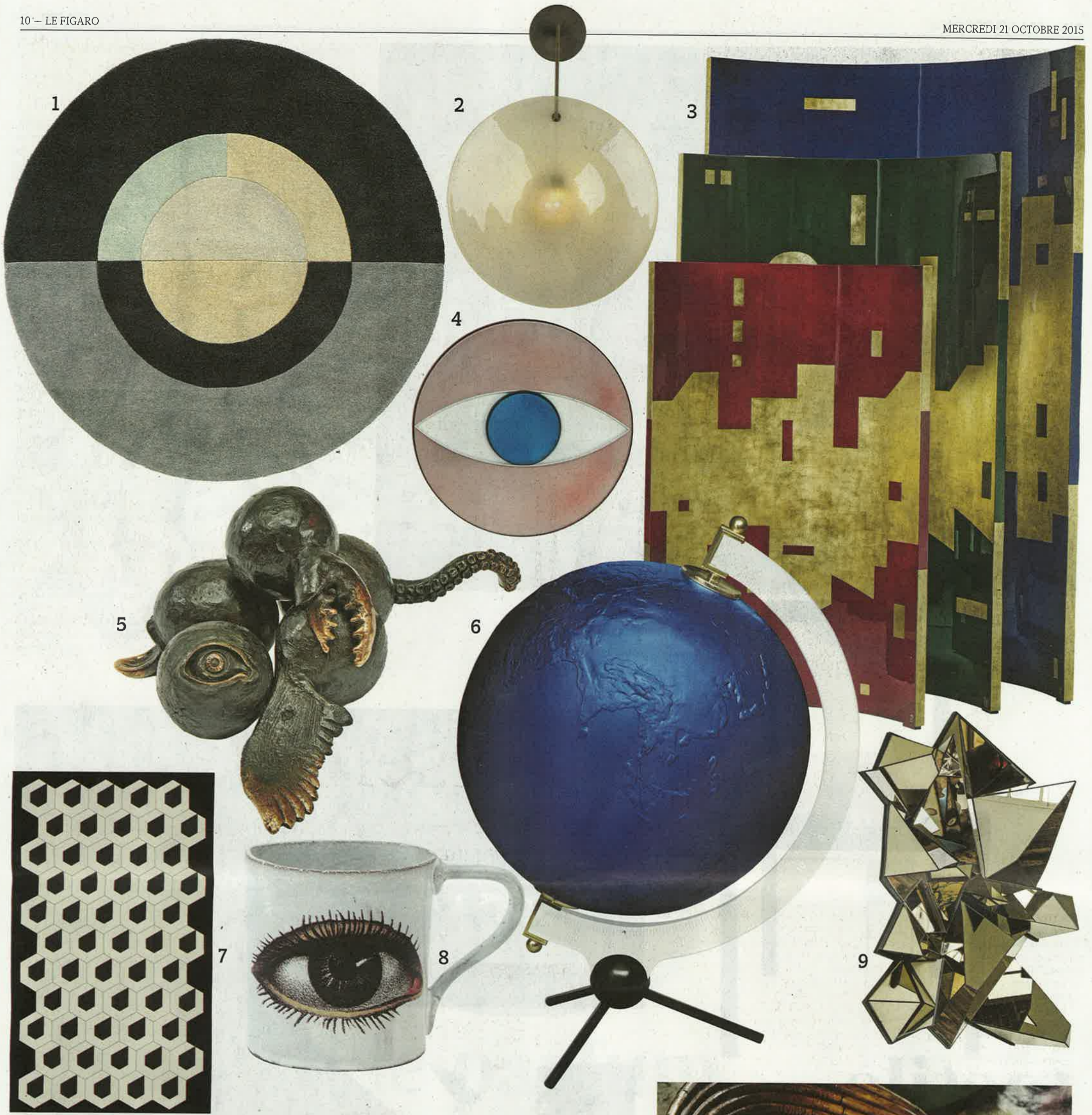
1. Tapis Moon, Bo Concept. 2. Orbe, applique bronze, soie et or. Design Patrick E. Naggar, Veronese. 3. Paravents-mirage, Pinto. 4. Plateau « Look at me » en acier, Umzikim, à la Galerie Imaginaire du Bon Marché Rive Gauche. 5. Sculpture Zooles, en bronze, Hubert Le Gall à la Galerie Avant-Scène. 6. Lampe La Terre Bleue Yves Klein by Lalique. 7. Céramiques In the Sky, Bisazza. 8. Mug dessin John Derian pour Astier de Villatte. 9. Sculpture miroir froissé Mathias Kiss, Galerie Armel Soyer. 10. Commode design Gio Ponti, tiroirs peints à la main sur façades, structure en bois d'orme, pieds en laiton satiné, Molteni. 11. Textile « Basquette » sur fauteuil Joe Colombo, Dedar. 12. Lampe grimpante à tiges flexibles Fleur de Givre fond noir, Tsé Tsé. 13. Miroir convexe, Felipe Ribon. 14. Vases Cube Murano, Fendi Casa. 15. Éléments modulables ici gris moyen, jaune, blanc. Plusieurs coloris, USM.